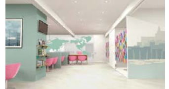
大阪支店 接客スペース