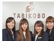
大阪支店 トラベル・コンシェルジュ

URL: http://www.tabikobo.com/special/osaka_cpn2/